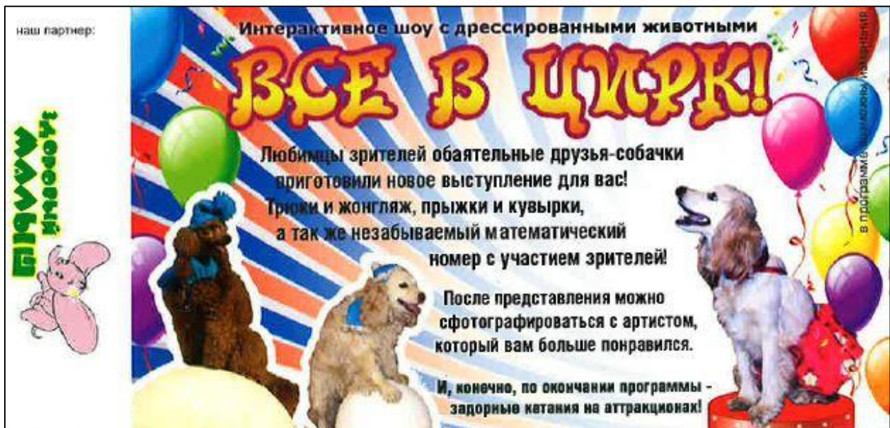
Билет «Все в цирк» (Vorderseite)