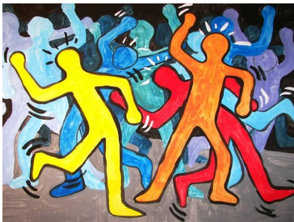
Schülerarbeit: In der Disco