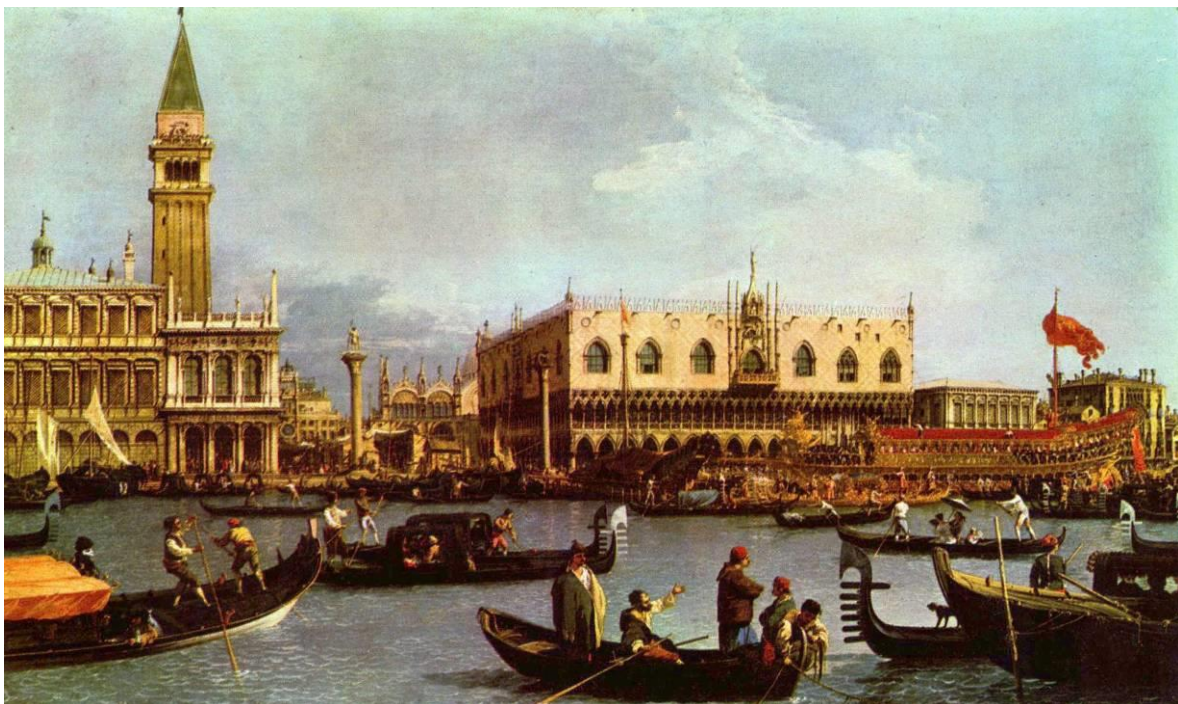
Giovanni Antonio Canal (Canaletto), Venedig, Die Rückkehr des „Bucentaurus“, um 1730

1 „Bucentaurus“: prachtvolles gerudertes Kriegsschiff