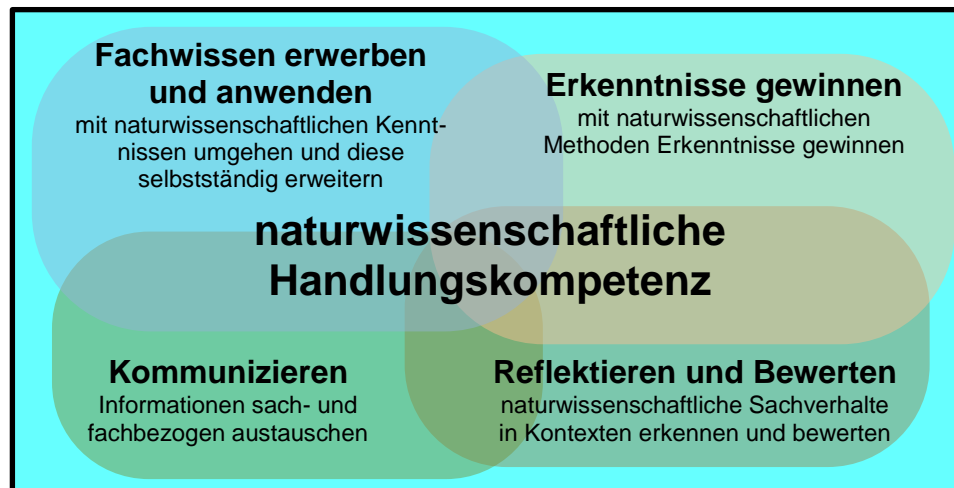
Abb. 1: Kompetenzmodell der Fächer Astronomie, Biologie, Chemie und Physik

Kompetenz- bereich Fachwis- sen erwerben und anwenden