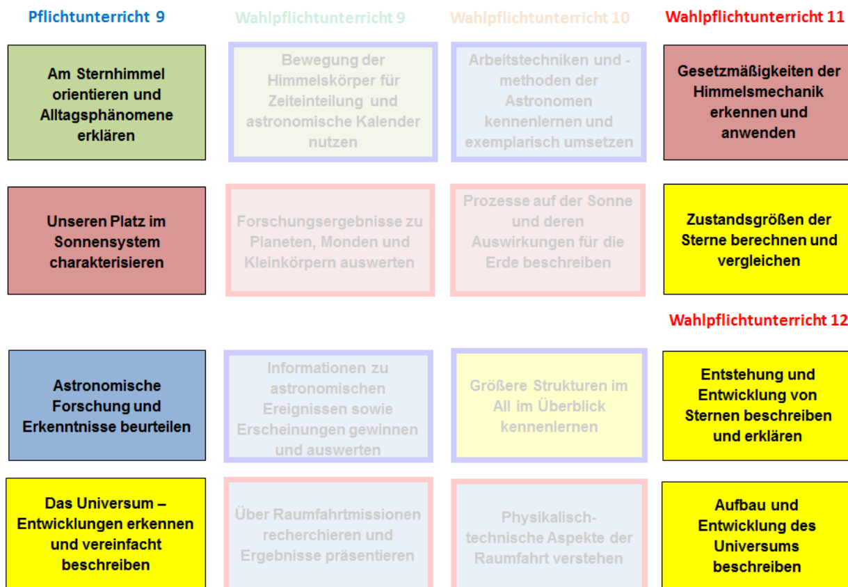
Abb. 3: Verknüpfungen und Linienführung bis zum Schuljahrgang 12

Die Kompetenzschwerpunkte für die Schuljahrgänge 11 und 12 des Wahlpflichtbereiches sind so konstruiert, dass sie Kompetenzentwicklung sowohl auf der Grundlage des Pflichtunterrichts im Schuljahrgang 9 als auch im Anschluss an den Wahlpflichtunterricht im Schuljahrgang 10 ermöglichen. Dabei berücksichtigen sie die Ansprüche an den mathematisch-naturwissenschaftlichen Unterricht der Qualifikationsphase und unterstützen die Entwicklung fachspezifischer Kompetenzen hinsichtlich der mathematisch-physikalischen Grundlagen.