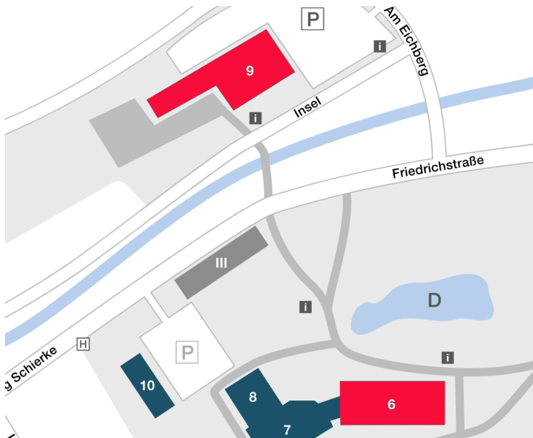
Abbildung 1: Auszug Campusplan

Die Fachhochschule Wernigerode möchte für Schüler und Studenten ein flexibles und skalierbares Netzwerktrainingszentrum einrichten, in welchem die Installation und die Konfiguration von Betriebssystemen, Anwendungen im Netzwerk und die Administration von Netzdiensten trainiert werden kann. Dabei sollen diese sowohl lokal auf den vorhandenen Arbeitsstationen und den Network Attached Storage Servern (NAS-Server) als auch virtualisiert auf speziellen Servern eingerichtet werden können. Das Trainingszentrum soll sich nahtlos in die bereits vorhandene IT-Umgebung der Fachhochschule integrieren und dessen Serverzentrum nutzen, jedoch ansonsten abgetrennt vom Fachhochschulnetz betrieben werden.