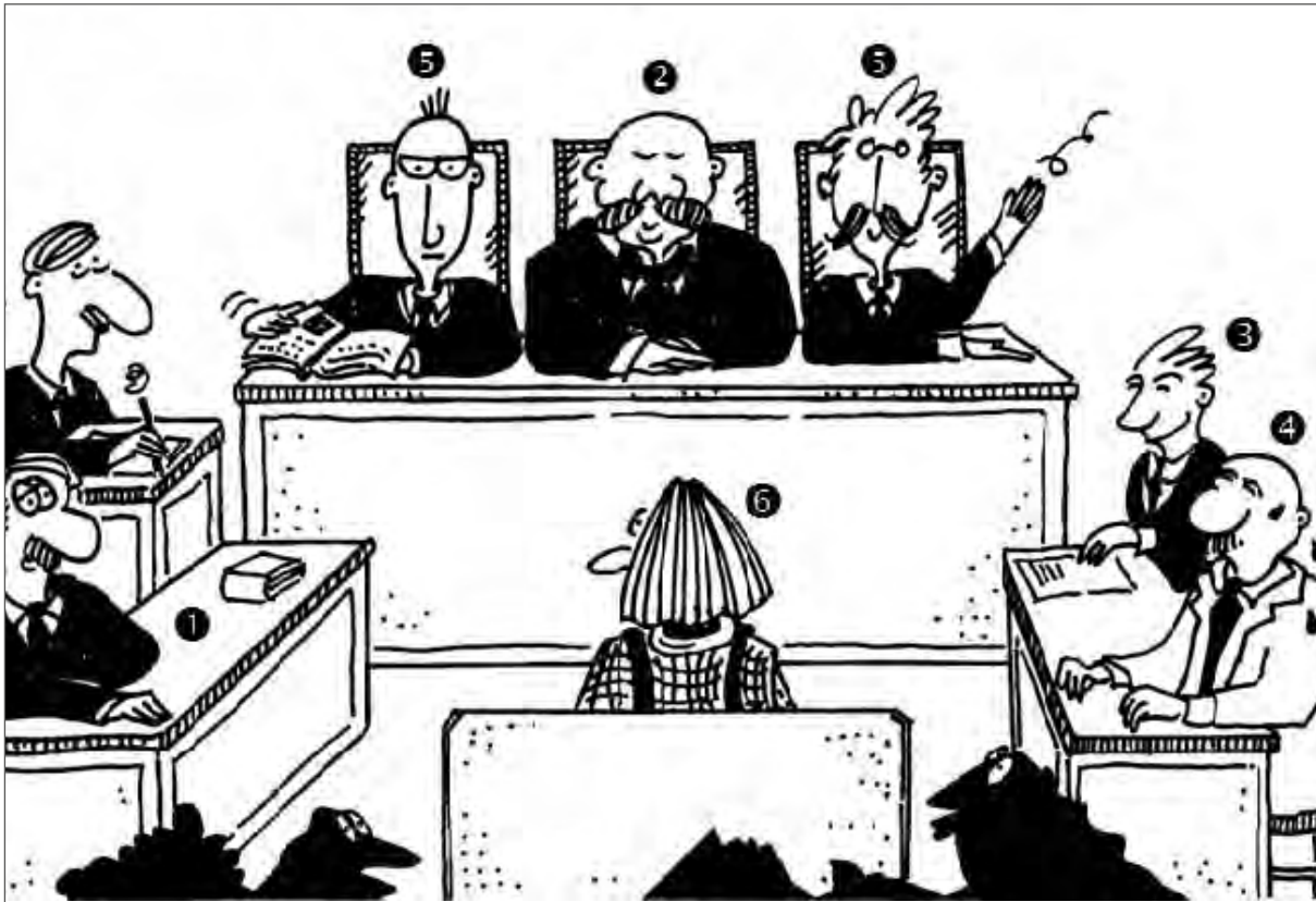
Abb.1: Zeichnung: Beatrix Franke. Aus: Rechtskunde, Band 1, Beiträge für den Unterricht in der Sekundarstufe I und II, © Ernst Klett Verlag GmbH, Stuttgart 2004