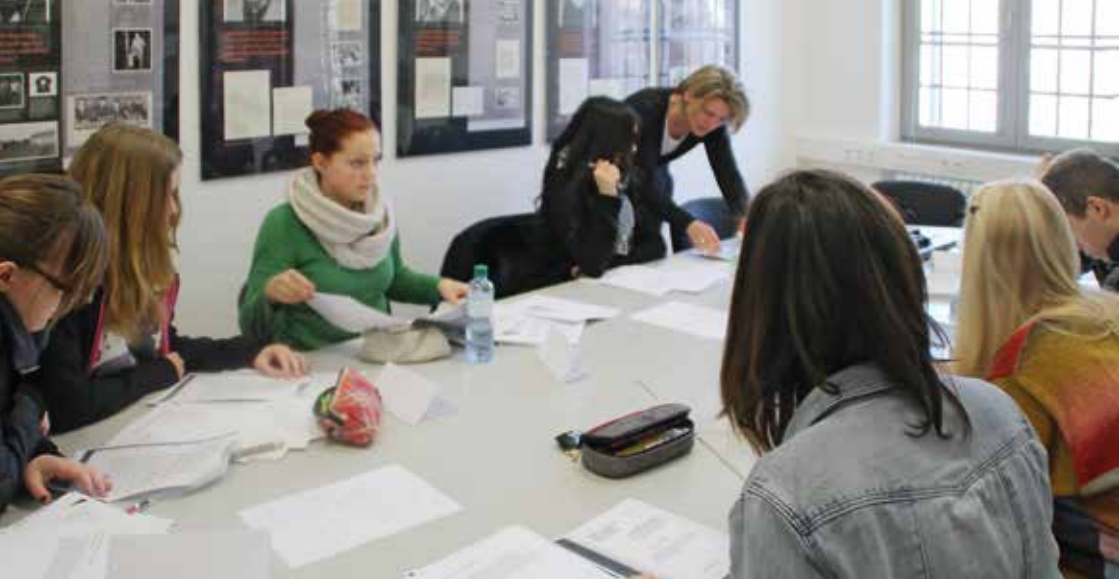
↑ Schülerinnen und Schüler während eines Projekttagess im Seminarbereich der Gedenkstätte Foto: Sammlung Gedenkstätte Moritzplatz Magdeburg → Schülergruppe während einer Führung im Bereich der „Freigangzellen“ Foto: Sammlung Gedenkstätte Moritzplatz Magdeburg