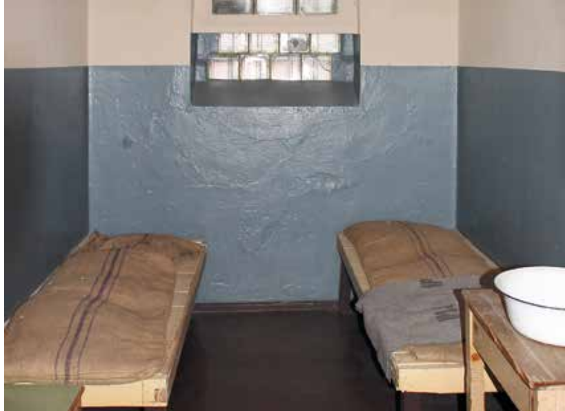
↑ Zweimannzelle im Hafthaus mit der Einrichtung aus den 1960er Jahren ← Strafgefängnis Magdeburg-Neustadt, 1940

1956 gingen die Inhaftiertenzahlen infolge eines vorübergehenden justizpolitischen Kurswechsels der SED-Führung insgesamt zurück. Daraufhin schloss die Verwaltung Strafvollzug der Bezirksdirektion der Volkspolizei (BDVP) Magdeburg im September 1956 die Untersuchungshaftanstalt (UHA) Magdeburg-Neustadt. Im Januar 1958 wurde das nun leer stehende Gefängnis an das Ministerium für Staatssicherheit (MfS) übergeben.