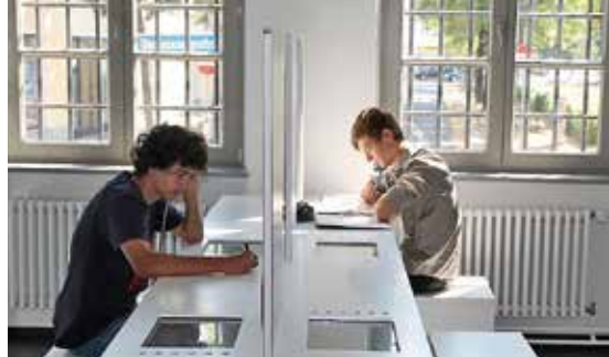
↑ Schüler arbeiten in der Dauerausstellung mit Videosequenzen aus Interviews mit ehemaligen Inhaftierten