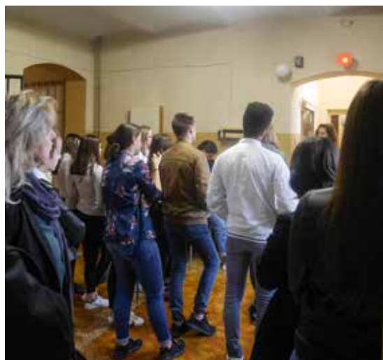
↑ Besucher einer Sonderausstellung im Veranstaltungsraum der Gedenkstätte