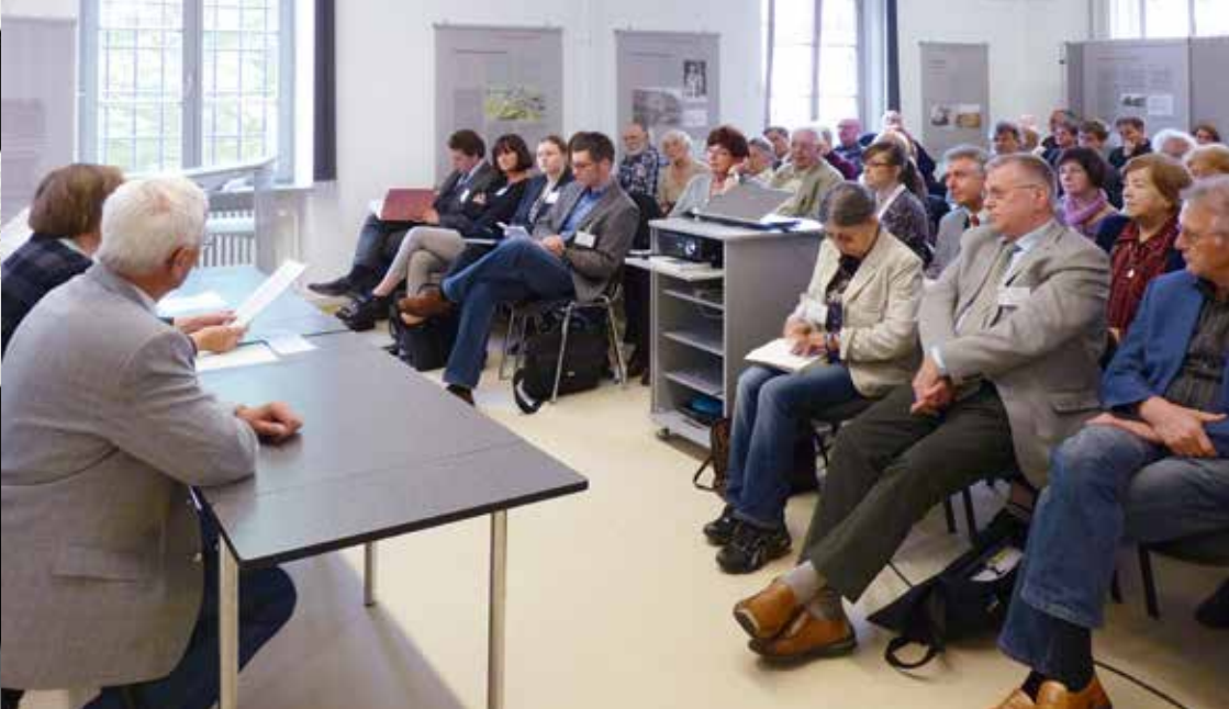
↑ Moderiertes Zeitzeugengespräch während einer Tagung im Veranstaltungsraum der Gedenkstätte