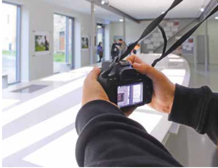
↑ Fotoworkshop „Auf Motivsuche in der KZ-Gedenkstätte Lichtenburg“, 2019 ← Projekttag mit Schülerinnen und Schülern der Sekundarschule Jessen-Nord