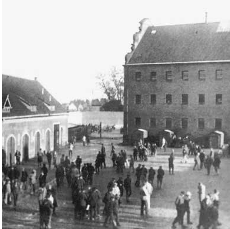
↑ Inhaftierte auf dem Nordhof, um 1935 ← Luftbild des Schlosskomplexes Lichtenburg, 1937

1936 beginnenden Errichtung von Barackenlagern, die eine neue Entwicklungsstufe im KZ-System markieren, wurde das Männer-KZ Lichtenburg schließlich aufgelöst: Die SS ließ die letzten verbliebenen Inhaftierten im August 1937 in das KZ Buchenwald verlegen. Noch vor ihrem Abtransport mussten sie mit den Vorbereitungen für eine Neubelegung des Schlosses beginnen. Innerhalb der Inspektion der Konzentrationslager (IKL), einer ab 1934 tätigen Verwaltungszentrale der SS, intensivierte man im Herbst 1937 die Bemühungen,