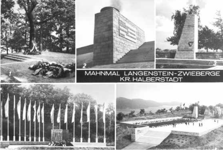
MAHNMAL LANGENSTEIN-ZWIEBERGE KR. HALBERSTADT