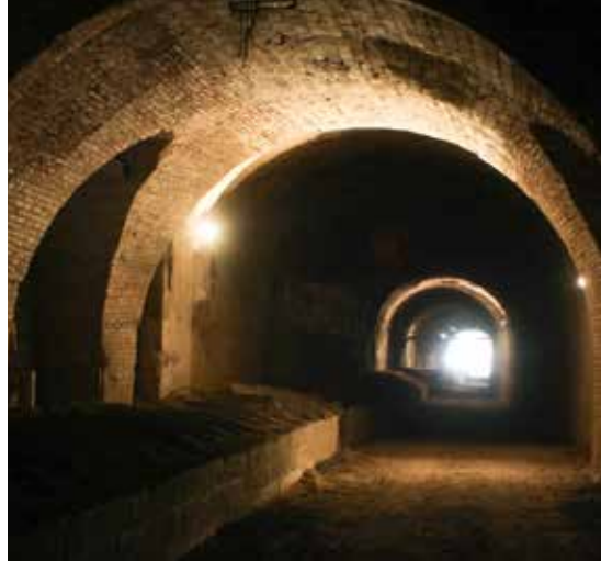
↑ Blick in den begehbaren Teil des Stollensystems