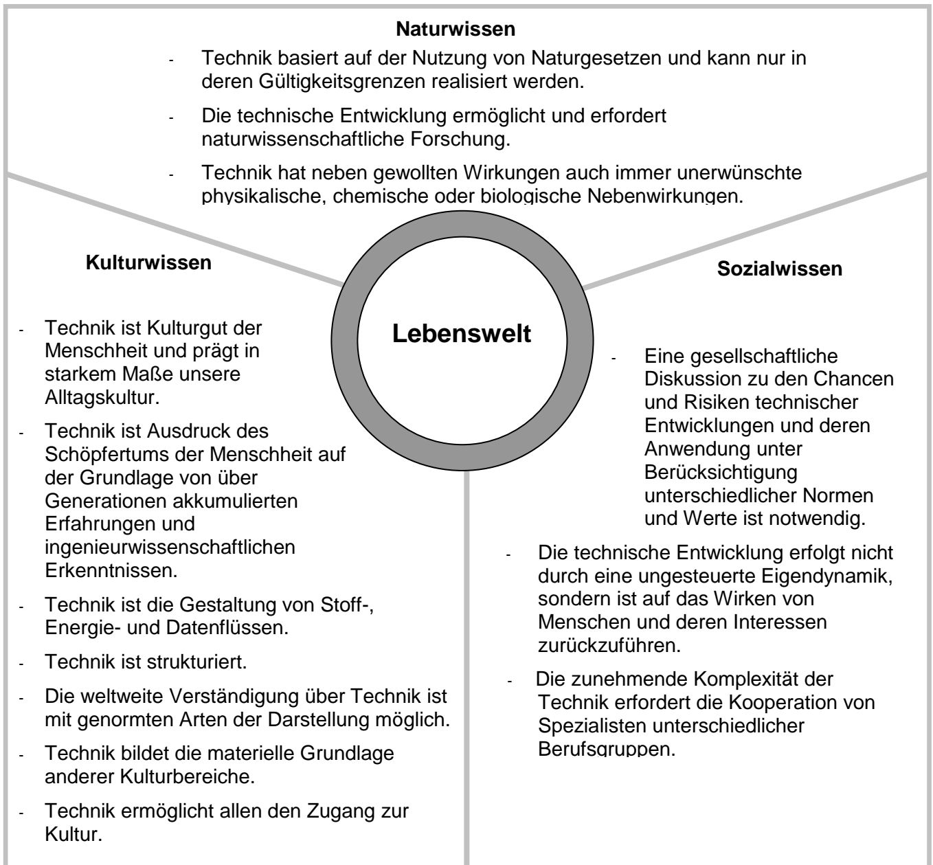
Abb. 2: Wissensbestände im Fach Technik

Die in den fünf Bereichen beschriebenen Kompetenzen umfassen auch spezifische Wissensbestände, über welche die Schülerinnen und Schüler flexibel und in verschiedenen Situationen der Lebenswelt (Kontexten) anwendbar verfügen sollen. Diese Wissensbestände werden hier in einer verallgemeinerten Form und nach den Kategorien Kulturwissen, Naturwissen und Sozialwissen geordnet dargestellt. Im Kapitel 3 erfolgt dann die jeweilige Konkretisierung.