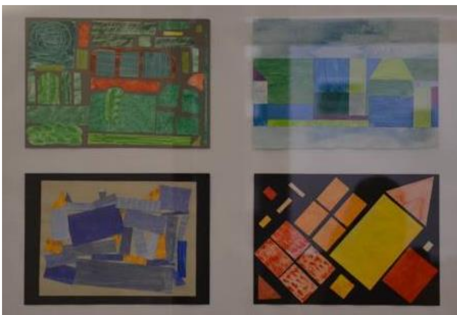
Stendaler Ansichten als „Ästhetische Forschung“ aus dem Hildebrand-Gymnasium Stendal