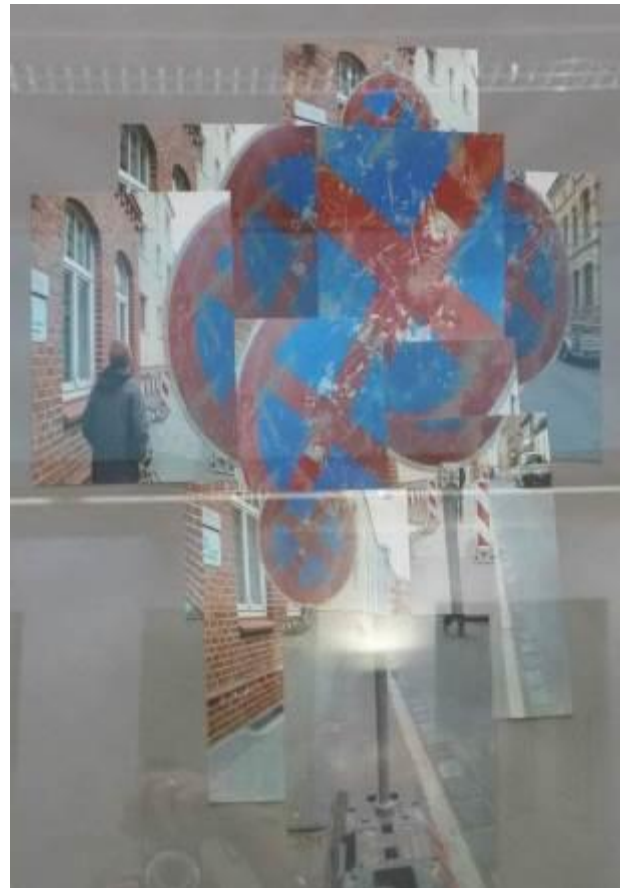
Architektur in Stendal entdecken und als Collage in neuer Sicht gestalten Hildebrand-Gymnasium Stendal