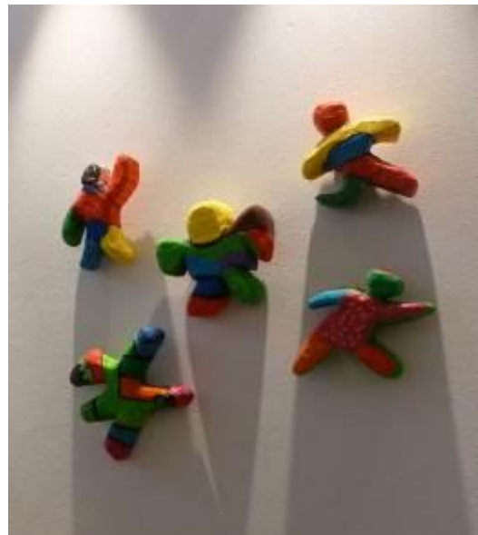
„Nanas“ aus der SKS „An der Doppelkapelle“ Landsberg