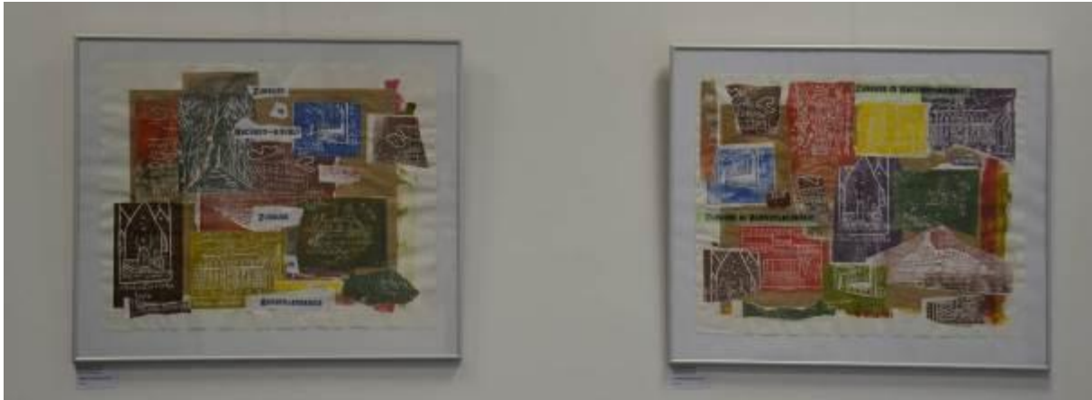
„In Sachsen-Anhalt zu Hause“ – Linolschnitt-Collagen aus der BbS Burgenlandkreis