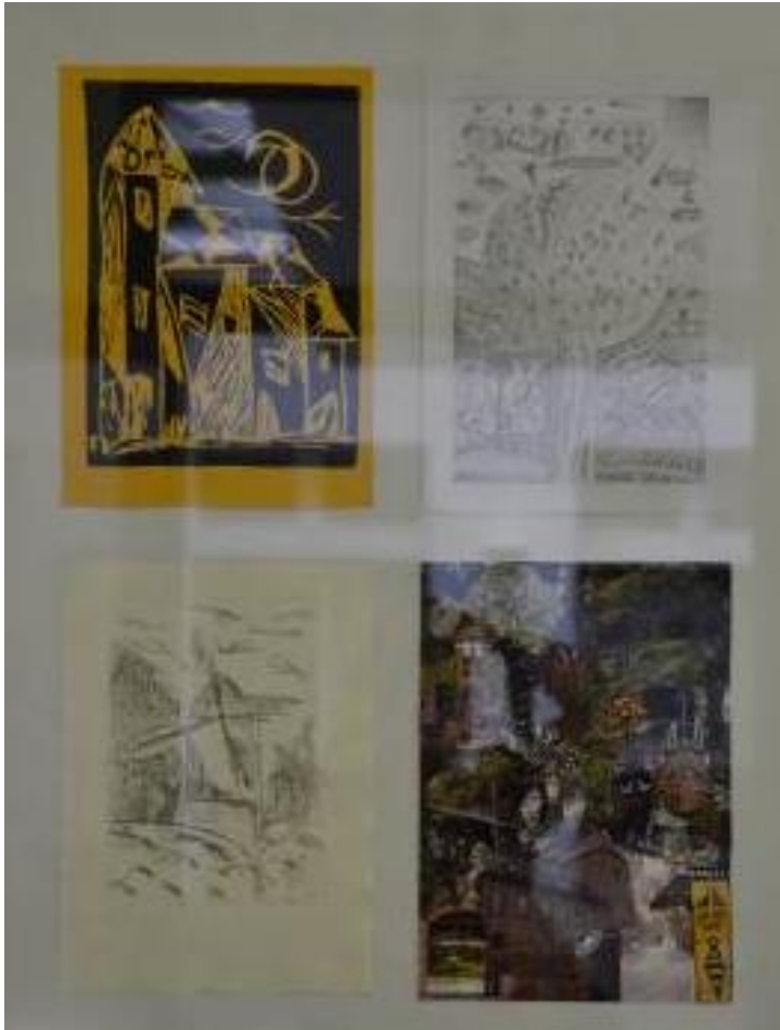
Börde-Impressionen der Schülerinnen und Schüler der Sekundarschule GTS Wanzleben